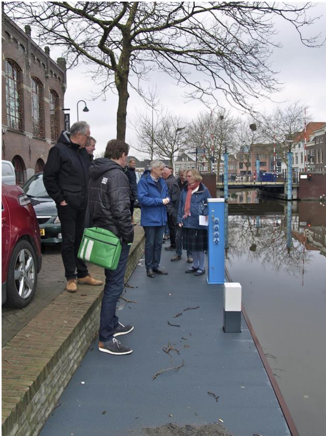
2017 Herstel steigers langs Regentesseplantsoen en Gouwe.